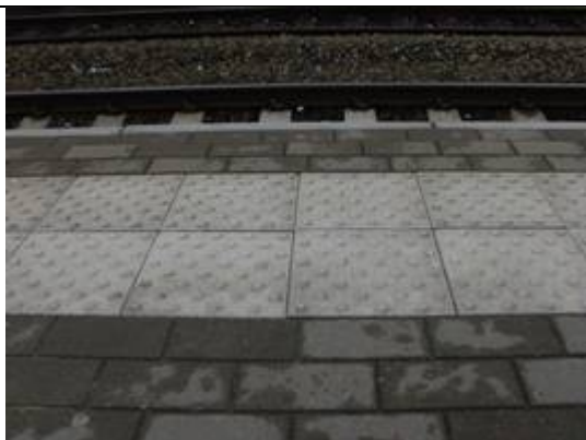
Dalles podotactiles sur 2 quais