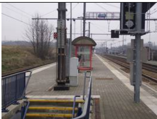
Revêtement des quais