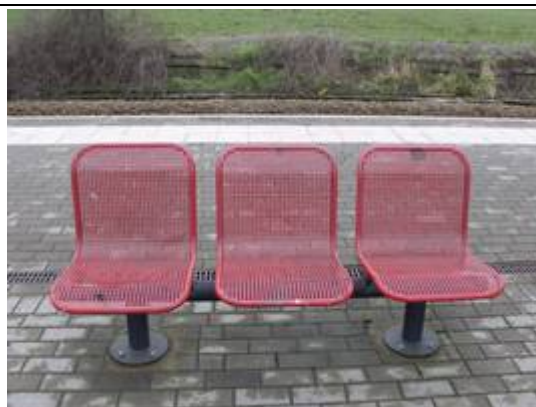
Sièges sur les quais