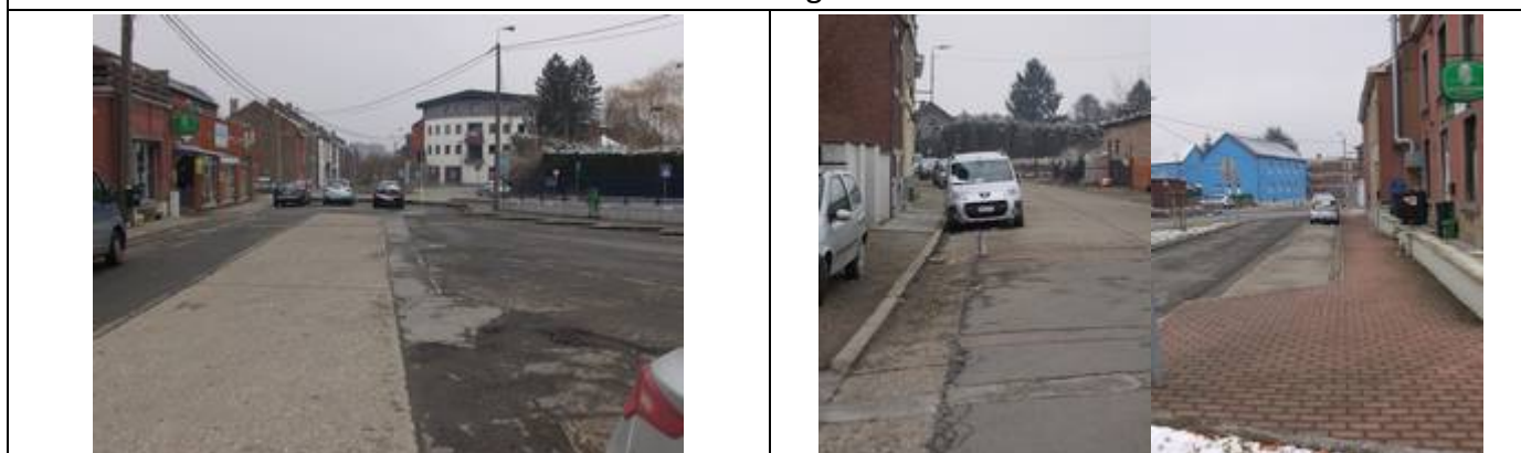
Possibilités de stationnement à proximité