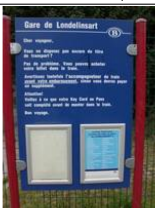
Fiches « Key Card »