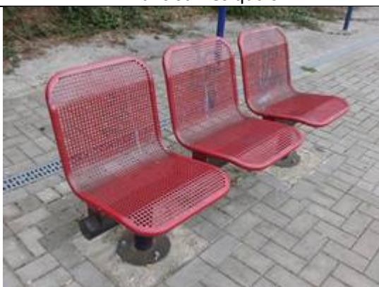
Sièges sur les quais

Des éclairages et des haut-parleurs sont disposés sur les quais.