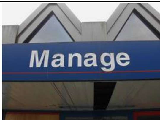
Panneau sur le bâtiment