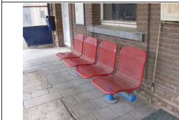
Sièges sur le quai couvert