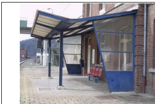
Quai partiellement couvert