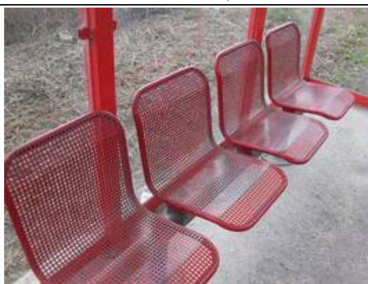
Sièges dans les abris