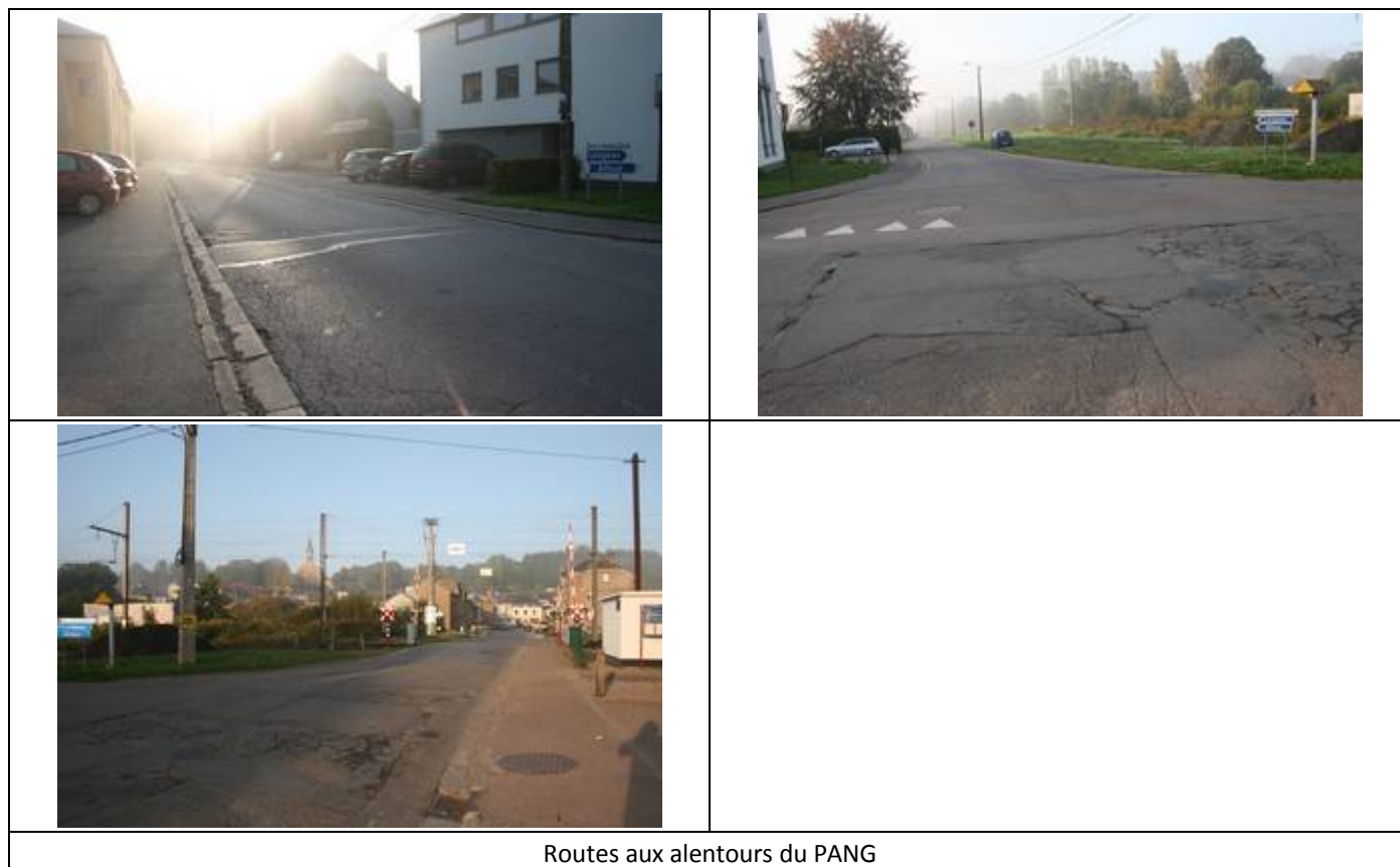
Routes aux alentours du PANG