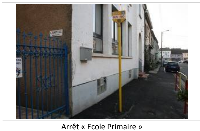
Arrêt « Ecole Primaire »