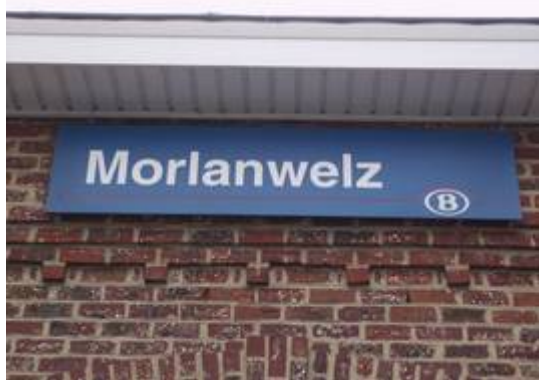
Panneau sur le bâtiment