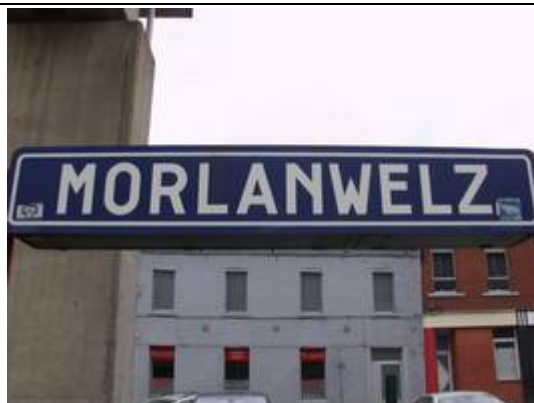
Panneaux sur les quais