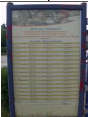
Fiches « Infos-Travaux »