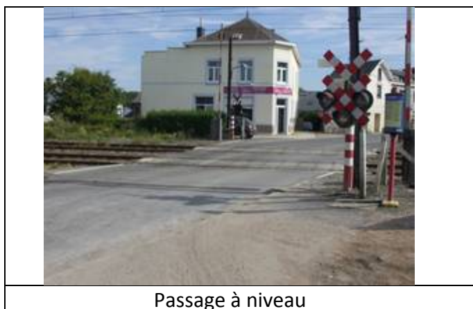
Passage à niveau