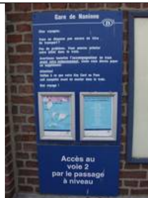
Fiches « Key Card »