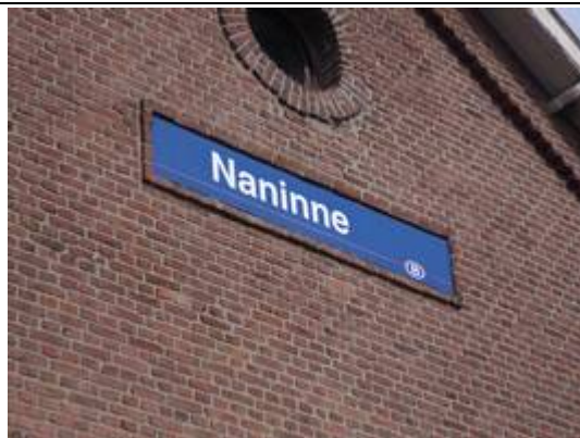
Panneau sur le bâtiment