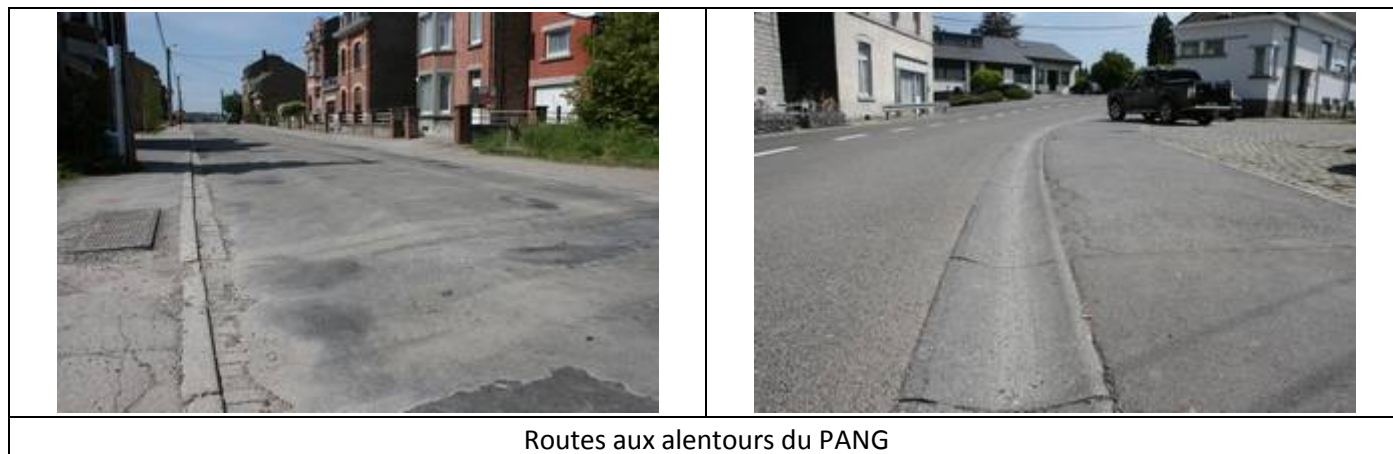
Routes aux alentours du PANG