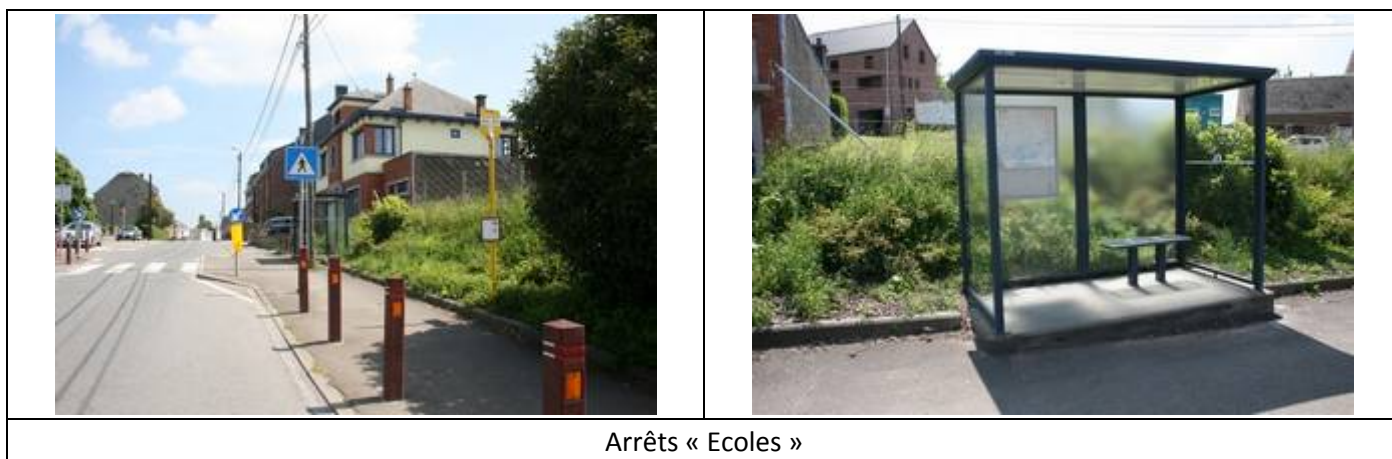
Arrêts « Ecoles »