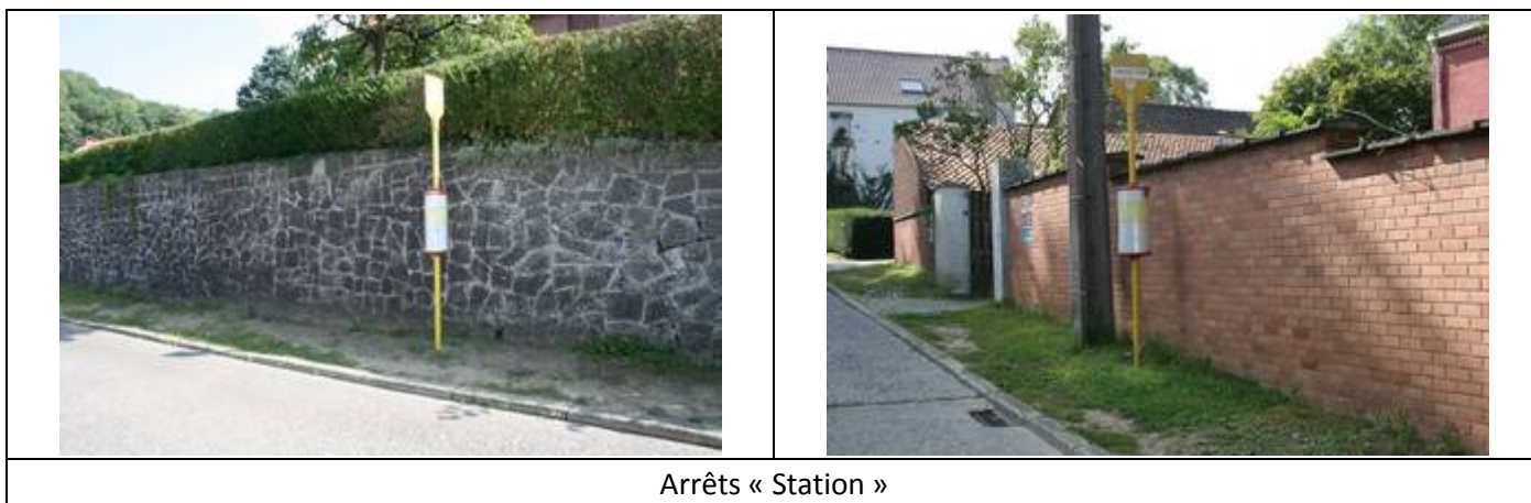
Arrêts « Station »