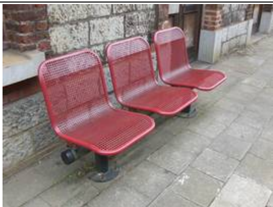
Sièges sur les quais/dans les abris

Des éclairages et des haut-parleurs sont disposés sur les quais.