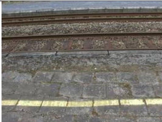
Absence de dalles podotactiles