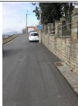
Possibilités de stationnement à proximité