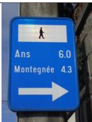
Indication du Ravel