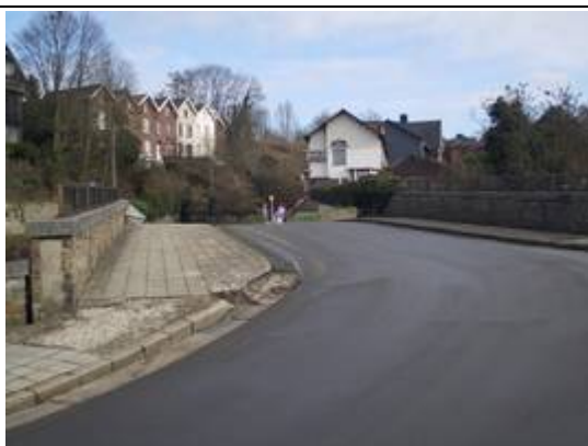
Pont au-dessus des voies