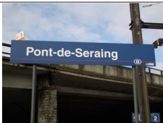
Panneau de dénomination côté « Namur »