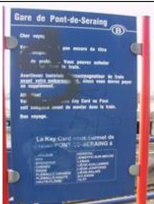
Fiches « Key Card »