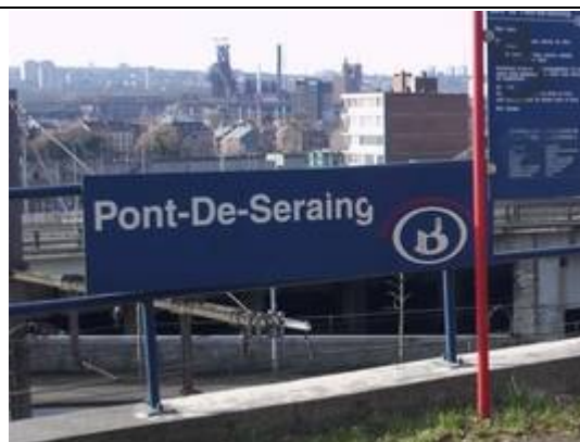
Panneau de dénomination côté « Liège »