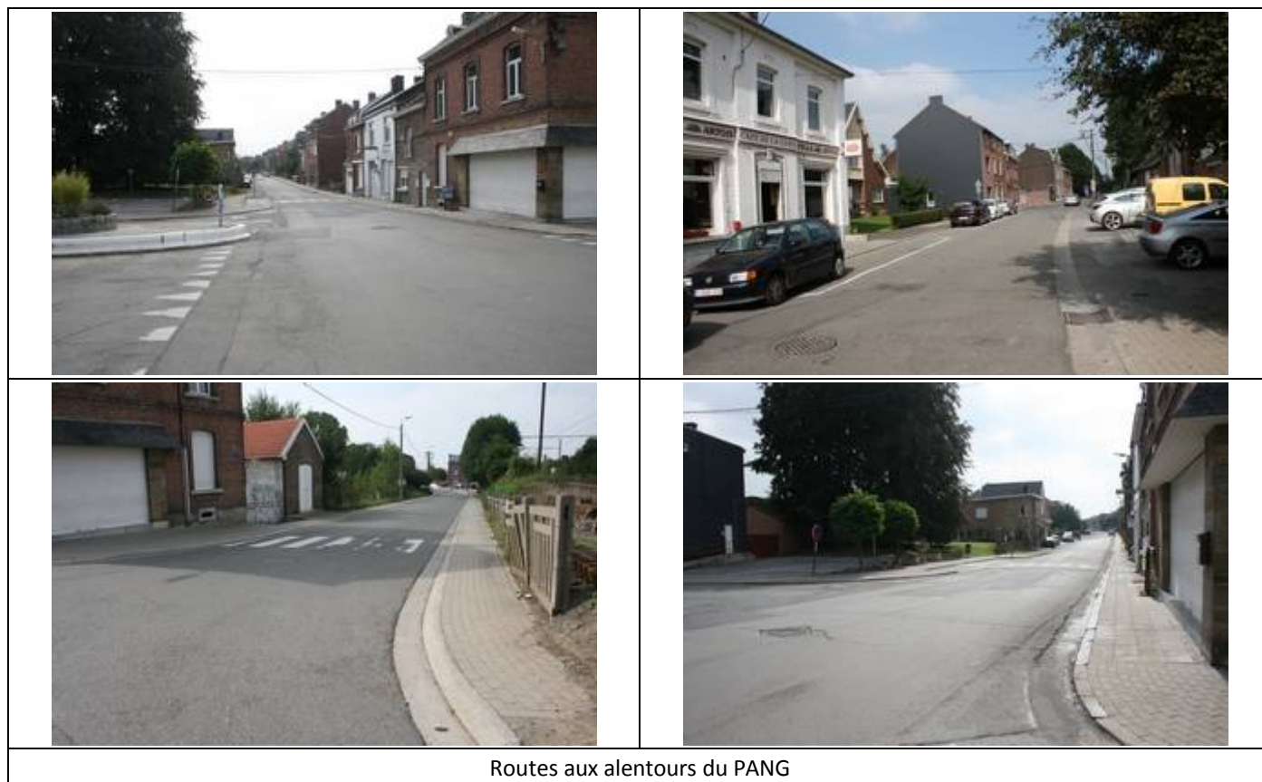
Routes aux alentours du PANG