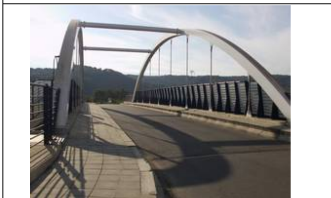
Pont au-dessus des voies