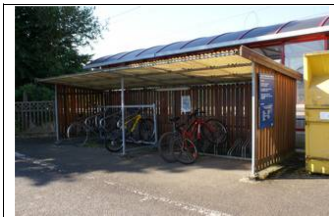
B-Parking cite 6 places, en réalité il y en a 11.