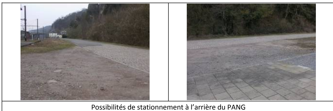
Possibilités de stationnement à l'arrière du PANG