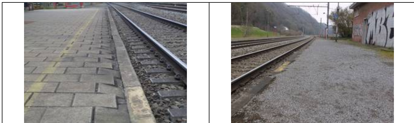
Revêtement des quais