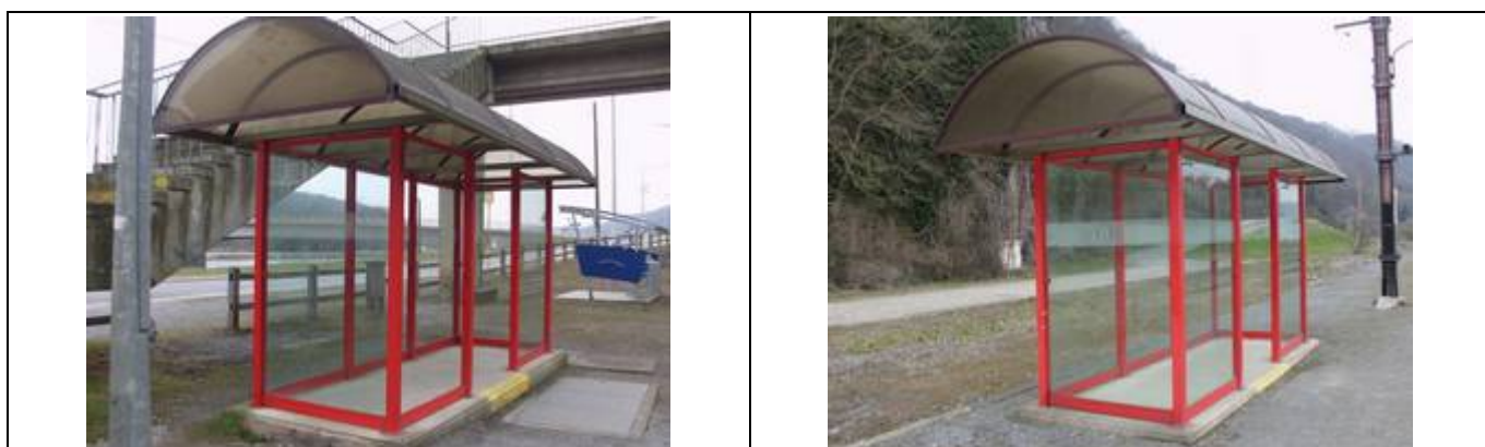
Abris sur les quais