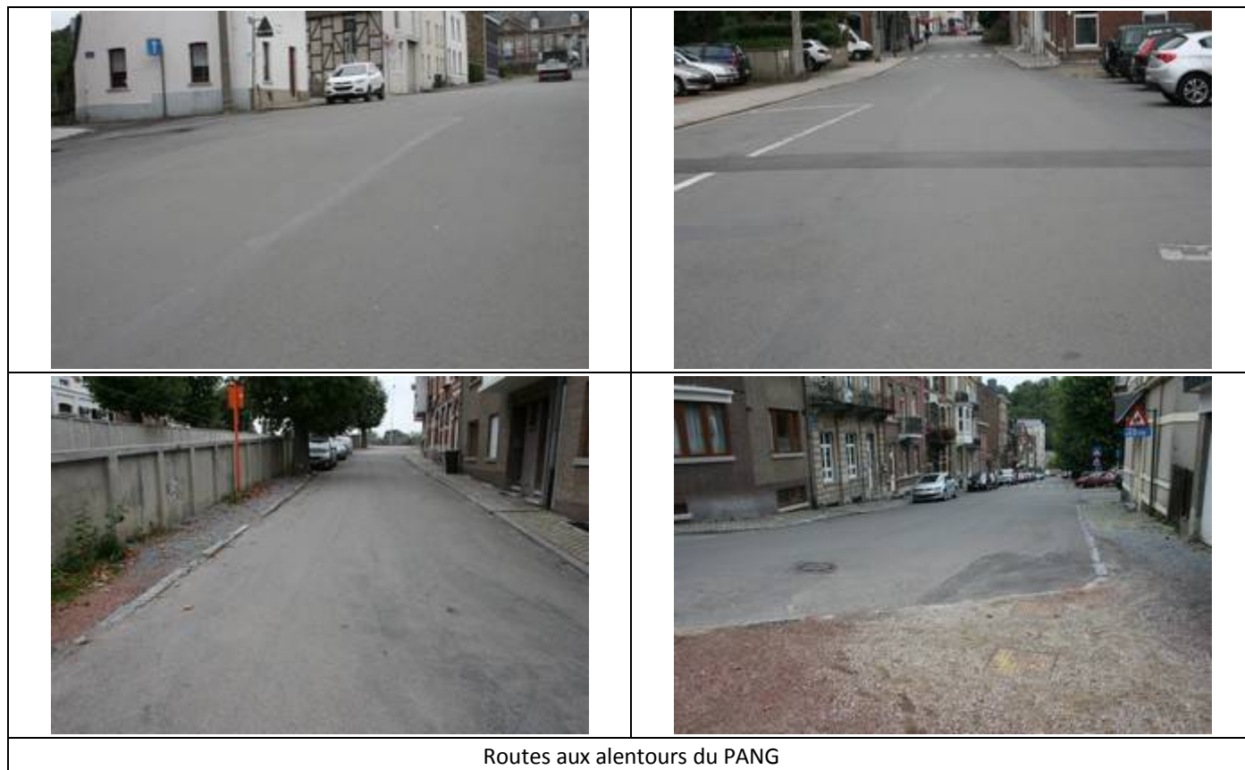
Routes aux alentours du PANG