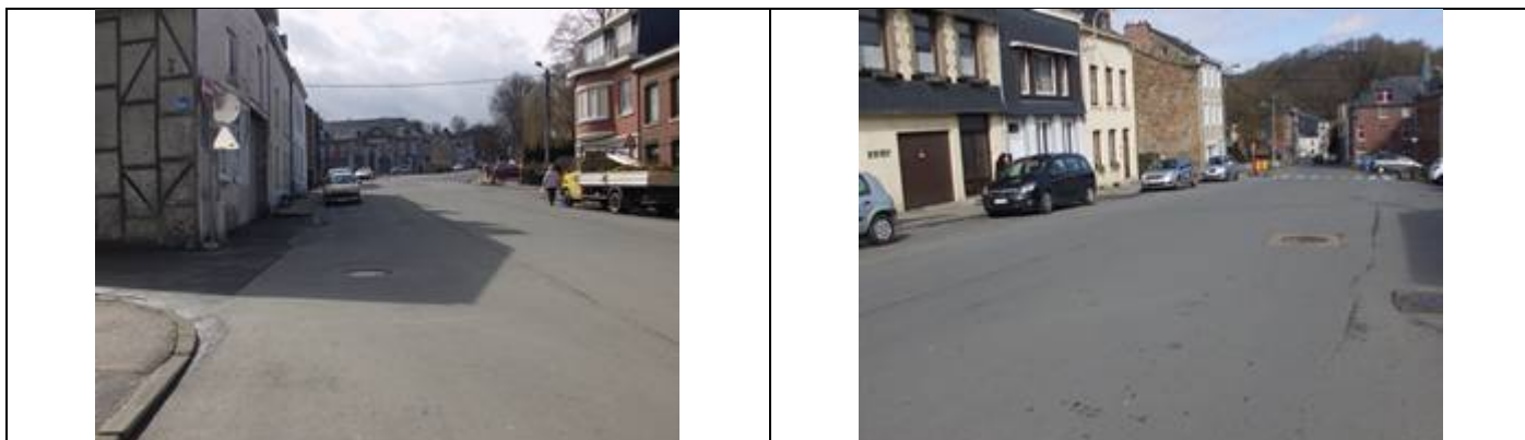
Stationnement en voirie