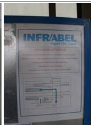
Fiches « infos-travaux »