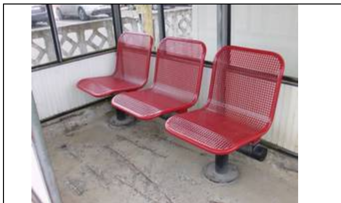
Sièges dans l'abribus

Des éclairages et des haut-parleurs sont disposés sur les quais.