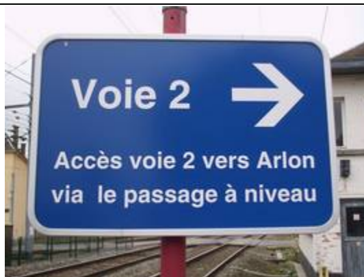
Direction des quais