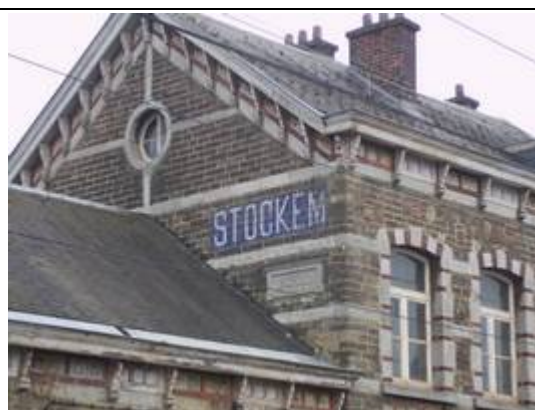
Panneau sur le bâtiment