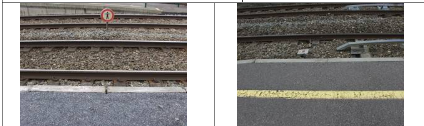
Absence de dalles podotactiles