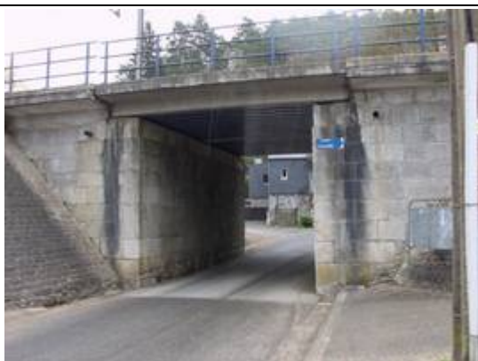
Pont sous les voies