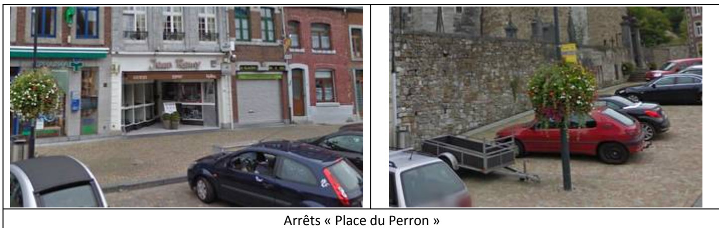
Arrêts « Place du Perron »