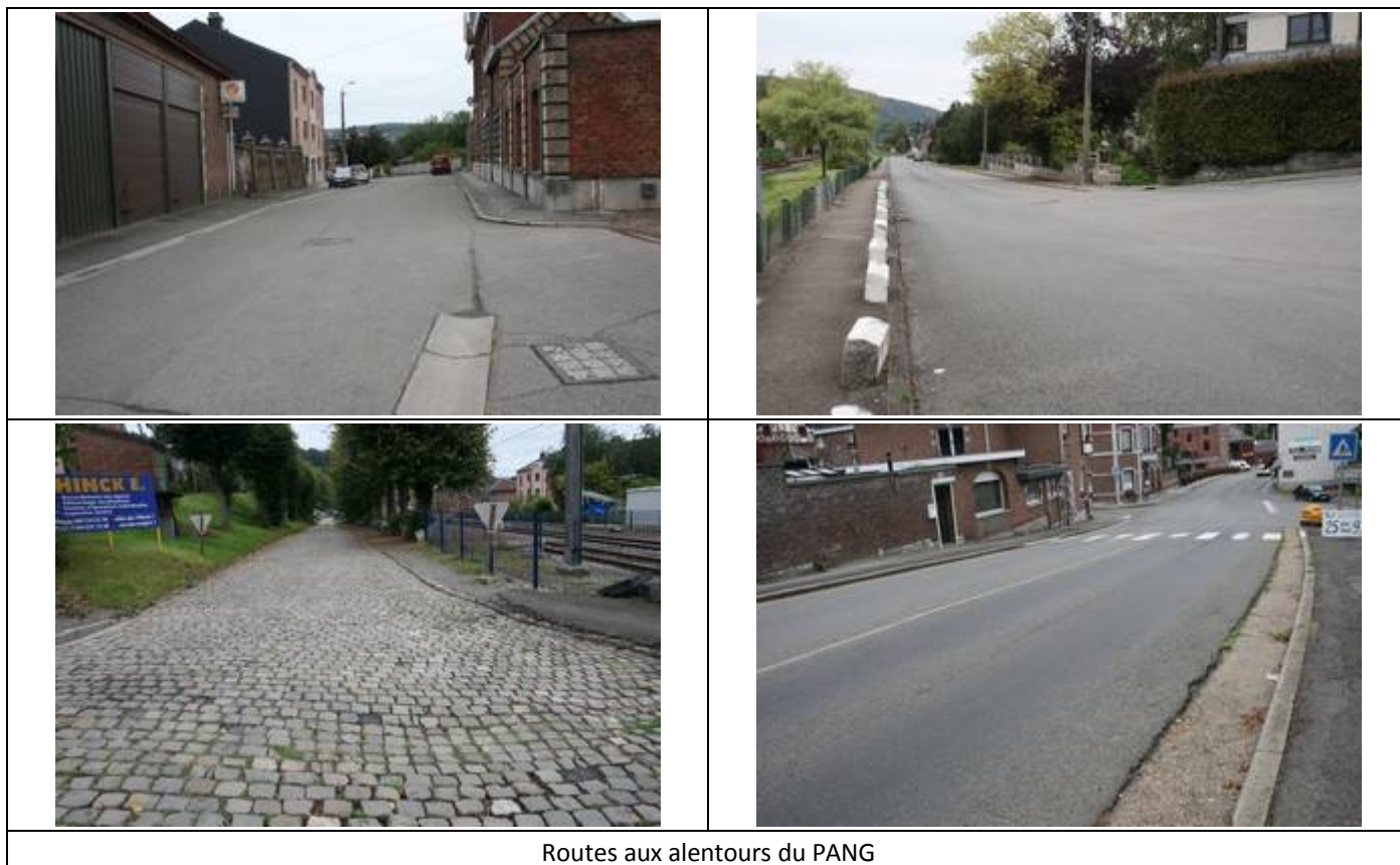
Routes aux alentours du PANG