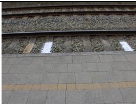
Absence de dalles podotactiles