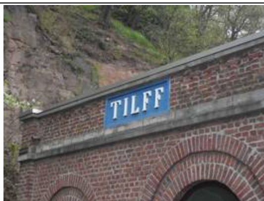
Panneaux sur le bâtiment