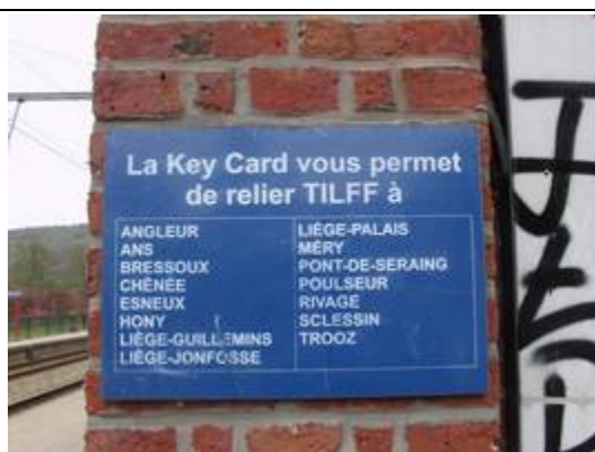
Fiches « Key Card »