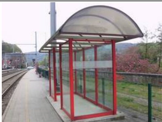
Abris sur les quais