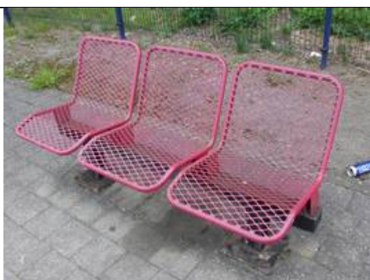
Sièges sur les quais

Des éclairages et des haut-parleurs sont disposés sur les quais.