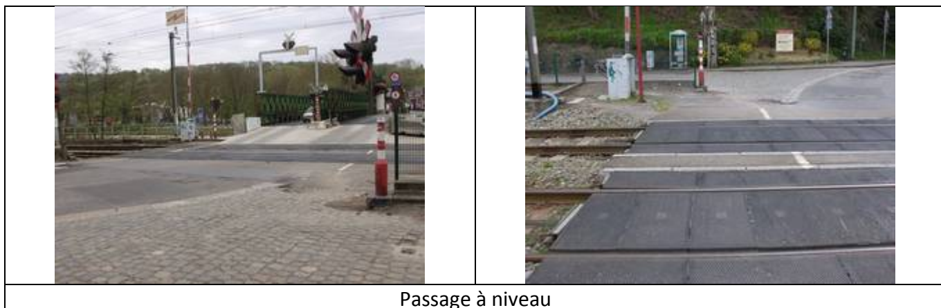
Passage à niveau