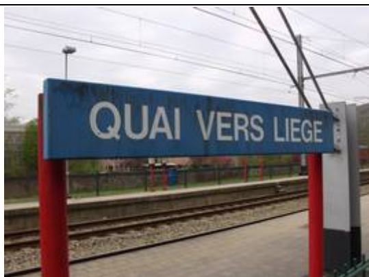
Panneaux indiquant la direction du quai