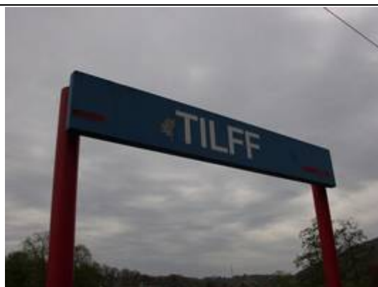
Panneaux sur le quai