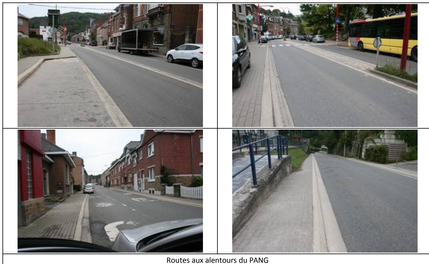
Routes aux alentours du PANG