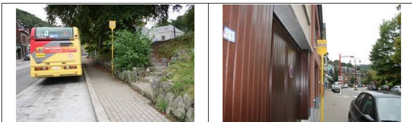
Arrêts « Gare SNCB »