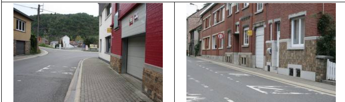
Arrêts « Avenue Fica »