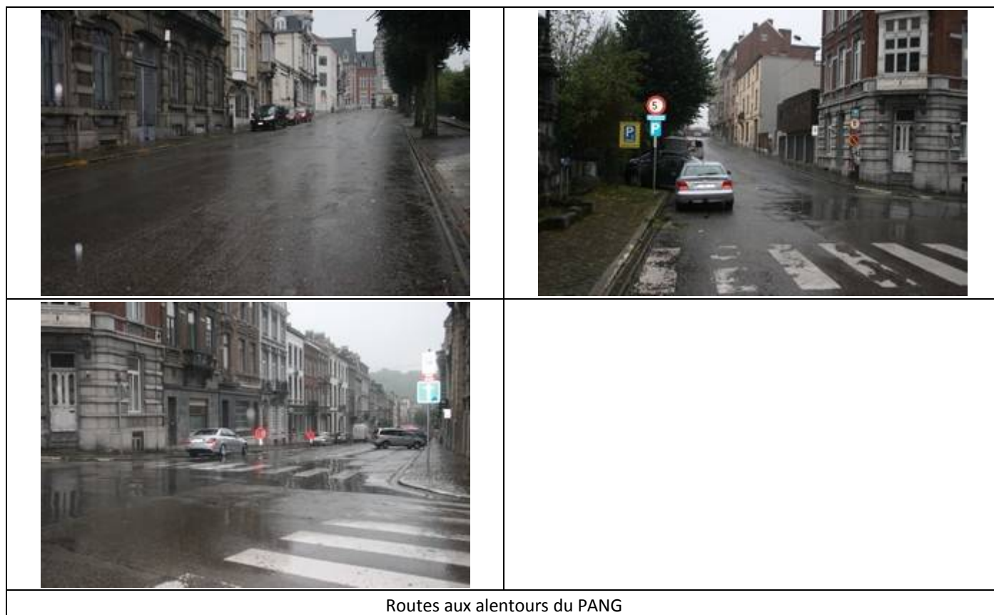
Routes aux alentours du PANG