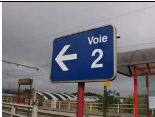
Panneaux d'accès aux quais