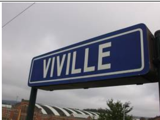
Panneaux sur les quais