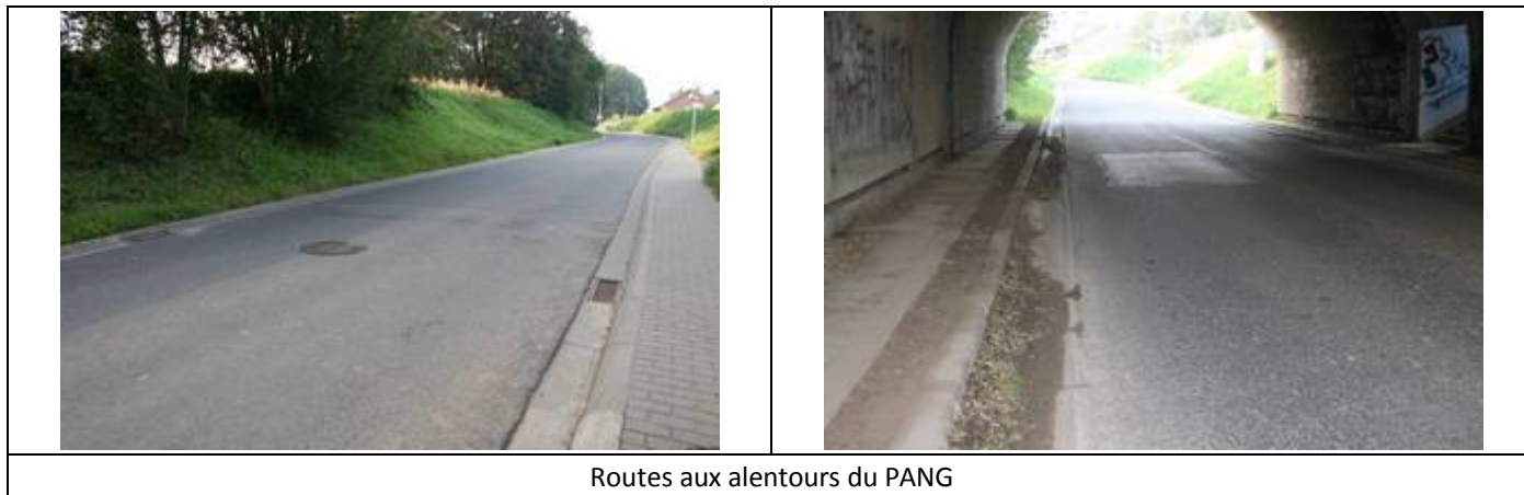
Routes aux alentours du PANG